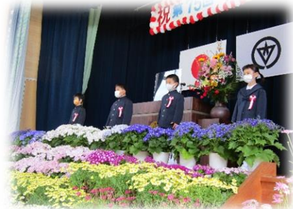
たくさんの拍手で迎えられました。

今年度は4名の新入生が安城小に入学してくれました。姿勢正しく堂々と入学式に臨み、名前を呼ばれると大きな声で返事をする事ができました。すごいですね。これからの活躍が楽しみな1年生です。