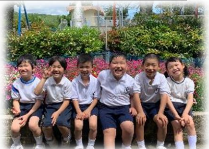
早速チームワークばっちりの1・2年生！