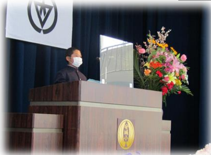
高学年として歓迎の言葉を堂々と発表。