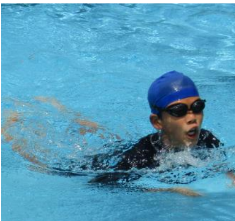
【全力で遠泳に挑戦する児童】

そして、失敗もたくさんしてほしいと思います。失敗や挫折の数だけ自分の成長もあります。子供のころの失敗はとても大切です。それは、大人になってからの本当の意味での挑戦につながるからです。親の庇護から離れた後、人生を自分の力で切り開く時が真の挑戦だと思います。その時のためにも「挑戦する夏休み」にしてほしいと思っています。