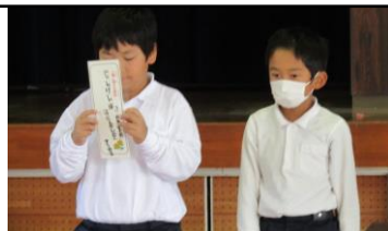
【人権標語の発表です】