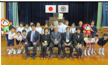
【人権の花運動閉級式】