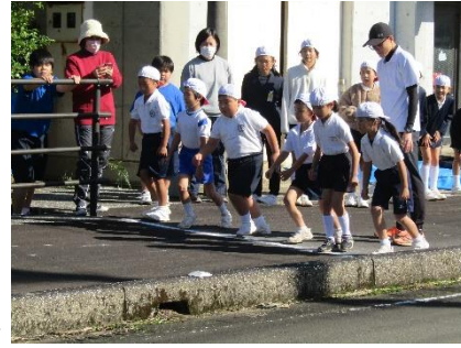
【元氣よくスタートを切った1・2年生】

持久走大会を実施するに当たり、コース整備をしてくださった上之町集落の方々をはじめ、たくさんの方々に御支援、御協力いただきました。本当にありがとうございました。