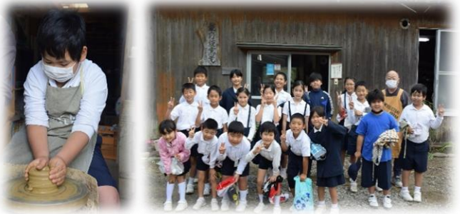
【ろくろ体験は力の加減が難しかったです】