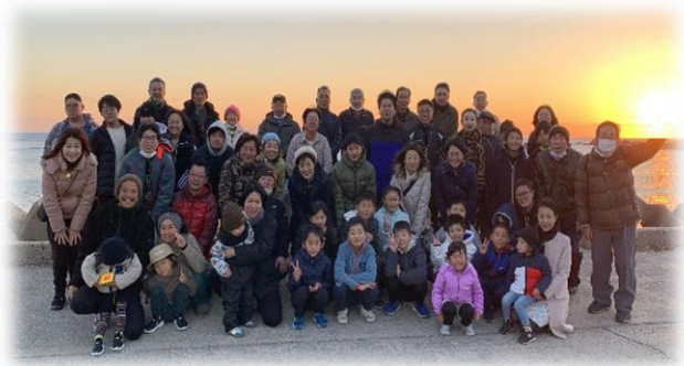
【初日の出をバックに記念撮影】