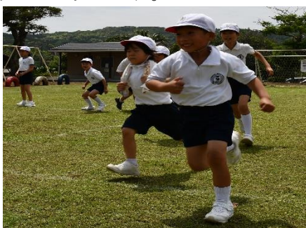
【思いやりの心を持ち、堂々と生きる安城の子供】

子供たちは、一人一台のタブレットを机の横に置いてうまく使いこなしながら授業を受けています。数年前には、考えられなかった光景です。そして、小学校でも高学年で英語が教科になり、プログラミング教育が低学年から行われています。これが教育の流行ならば、不易とは何であろうかと考えます。