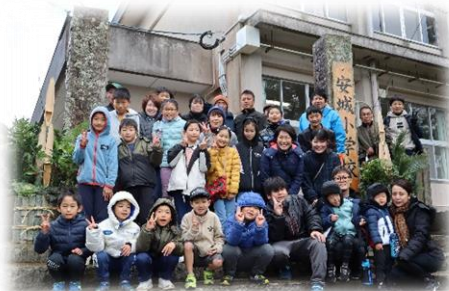
【きれいな門松が完成しました。】