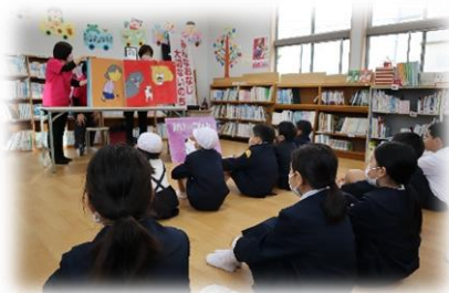
【読み聞かせの様子】

命の大切さや責任をもって生き物を飼うことなどを、普段から意識して生活している子供たちですが、今回の紙芝居を通してより具体的に考えることができました。