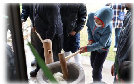
【気合を入れてきねをつきます。】