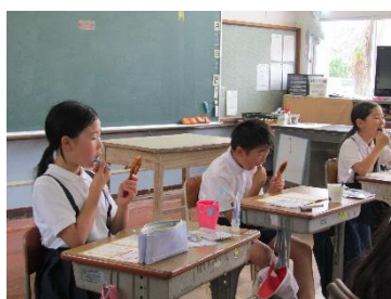
【5・6年の歯みがき指導の1コマ】

本校では昨年度に引き続き、むし歯治療率100%を目指して取り組んでおります。ぜひ、保護者の皆様の御協力をよろしくお願いいたします。