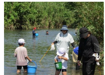
【暑い日の水辺での活動は、心地よいですね！】

当日朝、昨年度まで安城小に勤務されていた〇〇技師が、特製のえさを作りに来てくださいました。今年はだくまが少ないとの声もありましたが、みんな程よく捕まえることができました。中には、うなぎを捕まえる子も。水遊びをしながら楽しく活動することができました。