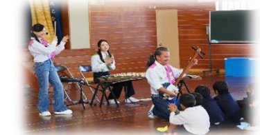
12月7日 さくらプロジェクト プロの和楽器演奏会