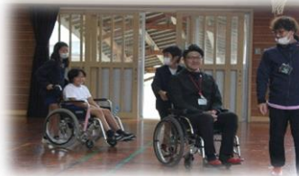
12月1日 「わらび苑」職員による福祉授業