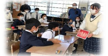
11月29日 種子島高校保健委員会による歯科指導