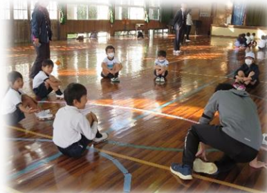
【1・2年生】 体育 少し緊張気味です！！

4校合同集合学習がありました。いつもは少人数・複式学級で学習をしている子供たちにとっては、たくさんの同級生と学習できる貴重な時間です。思いっきりボールゲームを楽しんだり、同級生の意見を聞いて考えたり・・・、充実した時間を過ごしました。