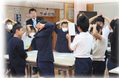
【4年生】 国語 大人数でのカルタは 盛り上がります！