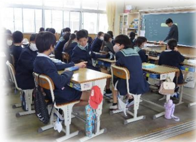
【6年生】 算数 教室いっぱいの同級生達。 中学校の授業は、こんな感じかな。この後、初めて出会った友達とゲームをしながら、「負」の数の学習をしました。