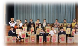
11月24日 高齢者との交流会