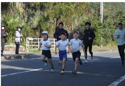
1・2年生 マンツーマンで伴走！！

2月10日(土) 暑くもなく、寒くもなく、良い持久走日和！今年も熊本地区陸上連盟の皆さんに御協力いただき、持久走大会を実施しました。走り慣れない公道と長く続く坂道に苦戦する子供たちでしたが、沿道の声援に励まされ、全員完走することができました。持久走は自分との闘いです。走りきった子供たちの「やりきった顔」は、これからの自分を支える力になると思います。応援ありがとうございました。令和6年度は、12月に実施予定です。