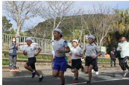
5・6年生 安納小を引っぱって走る大きな姿！