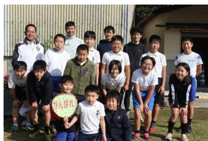
走り終えた顔！ みんな、いい顔です！