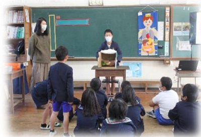
1月24日「保健指導」 野菜の栄養について学びました。「箱の中身クイズ」で大盛り上がり！！