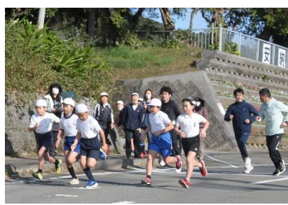
4年生 力強さが溢れるスタートです！