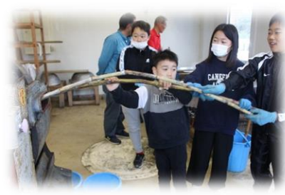
2月17日「さとうすめ」 今年も、校区の皆様をいただきさとうすめを行いました。留学生は初めての体験です。13日に収穫したさとうきびが、一つ一つの工程を経て、「黒砂糖」になる様子を、ただただ感動と感激でした！御協力いただいた皆様、本当にありがとうございました。