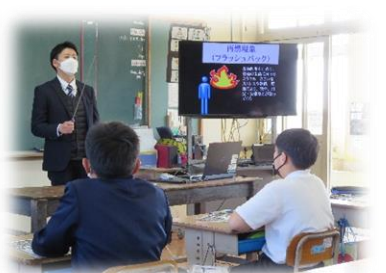
2月14日「学級活動」 薬物の恐ろしさや薬物から自分を守る大切さを学びました。