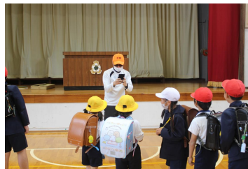
【安全な生活を守る訓練】