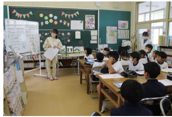
【図書室オリエンテーション】