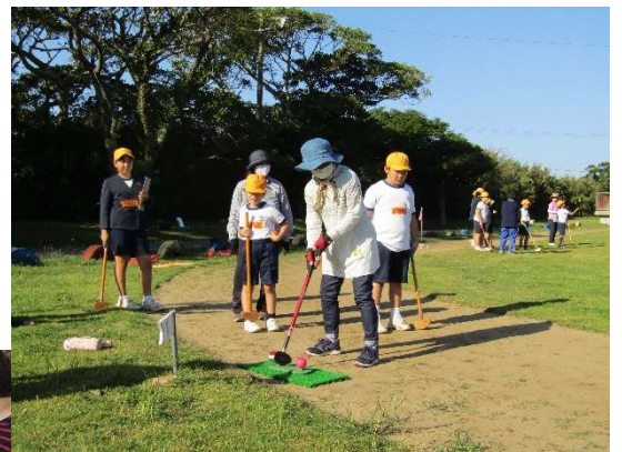
↑ 地域の方とグランドゴルフで交流