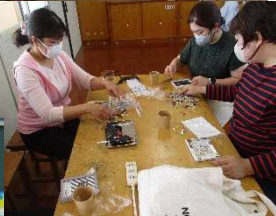
親子レクリエーション