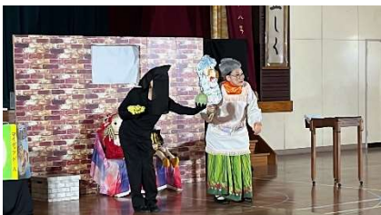
↑ 鑑賞参観を必ずし道徳参観→

した。この日の午後に行われたPTA親子レクリエーションも大変盛り上がりしました。これからも地域とともにある学校づくりを推進してまいりますので、本校の教育活動に対