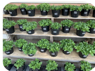
【校長室前のパチュニアも春を待ちわびているようです】

3学期に入って2週間が過ぎましたが、新型コロナウイルス感染症に加え、インフルエンザの罹患の報告も来ています。学校でも教室の換気や手洗い・うがいの指導など、対策を行っていきませんが、「 毎日の検温・健康観察 」や「 マスクの準備 」など、ご家庭でも感染拡大防止にご協力くださるようお願いいたします。