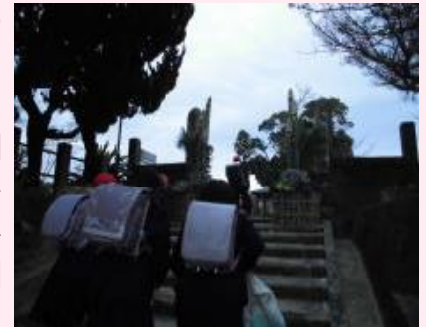
【1月9日朝の登校の様子】

1月9日(火)3学期始業日、おやじの会の皆様が作ってくださった門松に迎えられ、子供たちが元気に登校してきました。冬休み期間中、大きな事故もなく、450人の子供たちとともに3学期のスタートができたことが何よりうれしいことです。今年も子供たちの健やかな成長を願い、職員一同「チーム榕城」で頑張っていきます。3学期も学教教育へのご理解とご協力をよろしくお願いいたします。